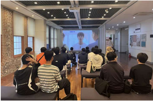
① 동아대 석당박물관 소개 영상 관람