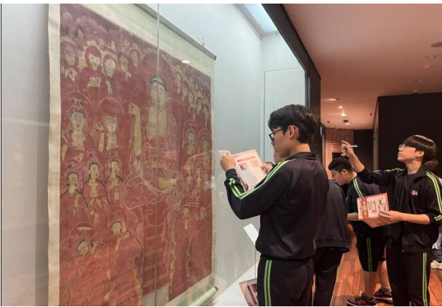
③ [상반기] 관람형 미션: <붉은 벽돌의 비밀>