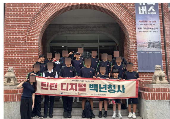
⑥ 단체 사진 촬영