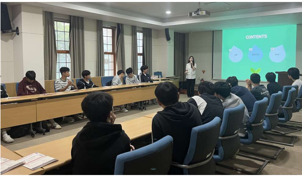
④ 동아대학교 전공멘토단의 전공 안내와 진로 상담(좌: 경찰학과, 우: 교육학과)