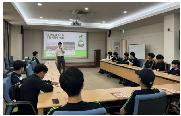
② 동아대 박물관 학예사(큐레이터)의 소장품 설명