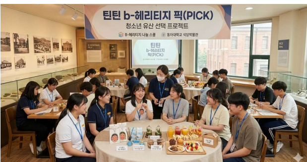
⑤ 소감 나누기(체험 기념품 및 다과 제공) *시 이미지