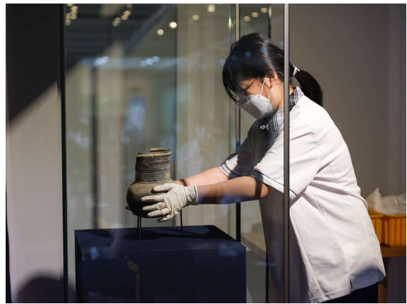
③ [하반기] 실무형 미션: <나도 큐레이터>