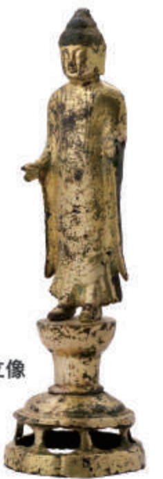
宜宁 菩提寺址 金铜如来立像 宝物 统一新罗 9世纪