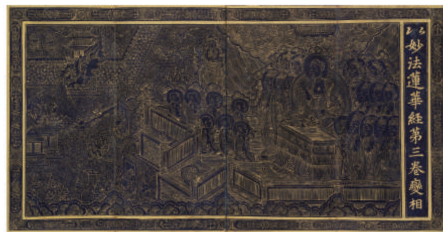
绀纸银泥 妙法莲华经 卷3 宝物 朝鲜 1422年