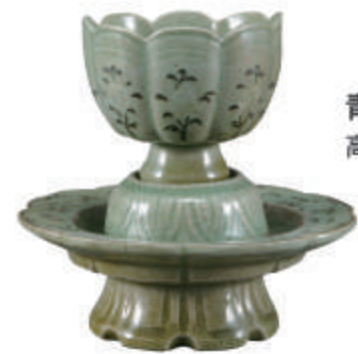
青瓷镶嵌菊花纹花型托盘 高丽 13世纪