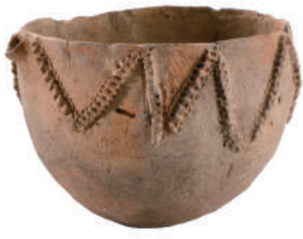
陶制隆起纹钵 宝物 永善洞贝冢出土 新石器时代