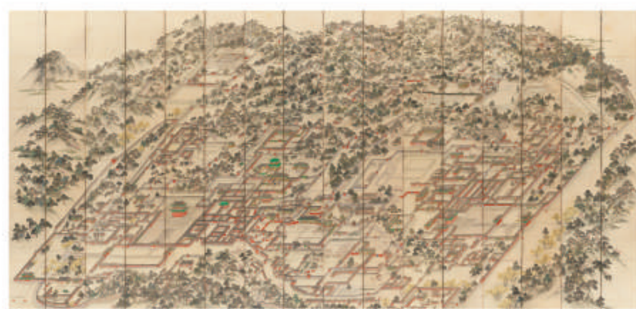
东闕图(1995) 国宝 朝鲜 1828-1830年

这幅画描绘的是位于朝鲜王朝宫殿-景福宫东侧的昌德宫和昌庆宫的宫廷画。雄伟的宫殿建筑群与周围山水交相辉映，展现了这一带壮观景象。