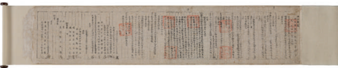
沈之伯 开国元从功臣录卷 国宝 朝鲜 1397年

这幅画描绘的是位于朝鲜王朝宫殿-景福宫东侧的昌德宫和昌庆宫的宫廷画。雄伟的宫殿建筑群与周围山水交相辉映，展现了这一带壮观景象。