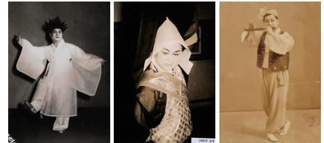
무용가 황무봉 아카이브 자료 Archives of Hwang Moo-bong, A Dancer 20세기 / 황미혜 기증