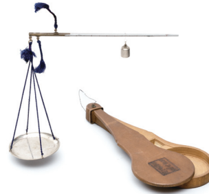
약저울 Pharmacy Scales 20세기 / 신기현 기증