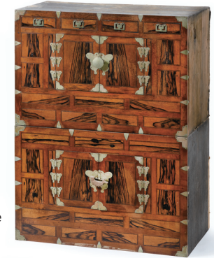
이층농 Two-Tiered Wardrobe 20세기 / 남갑순 기증