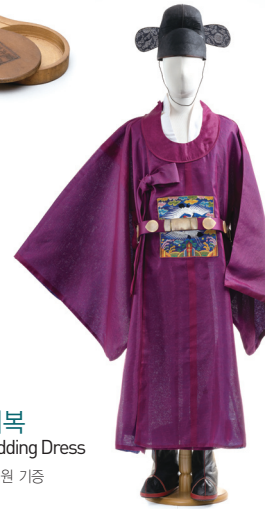
남성 혼례복 Groom's Wedding Dress 1980년대 / 손혜원 기증