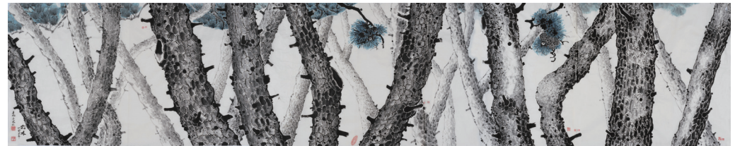
松林 Pine Forest 천봉근 / 2013 / 천봉근 기증