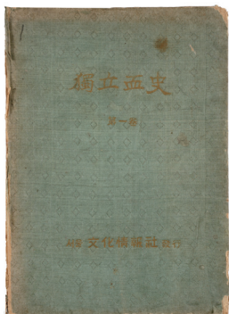
독립혈사 제1권 Book of Independence Activists 1949 / 박찬현 기증