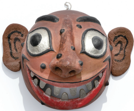
말뚝이 탈 Stableman Mask 전 양세주 / 1970 / 김군자 기증