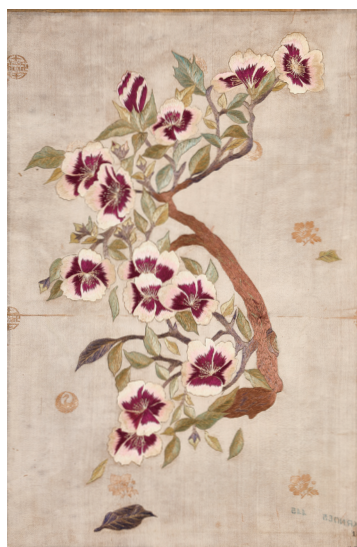
자수무궁화지도 Embroidered Korean Map with Korean Peninsula(Mugunghwa) 20세기 / 좌성일 기증