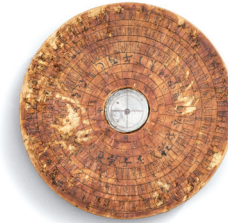
윤도 Compass 20세기 / 김성동 기증