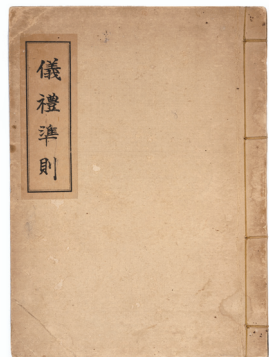
의례준칙 Korean Rite Standards 1934 / 김정기, 김한모 기증