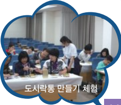
도시락통 만들기 체험