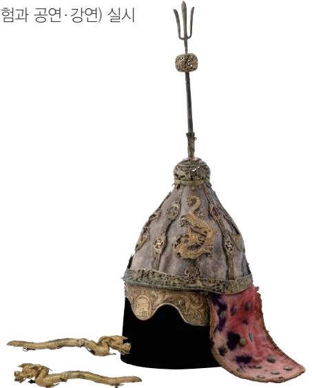
원수명 가죽투구와 어깨장식