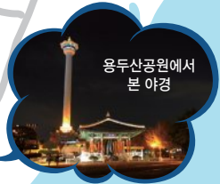
용두산공원에서 본 야경