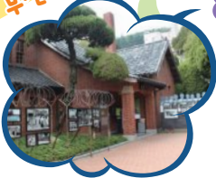
보수동 책방골목 극제시장